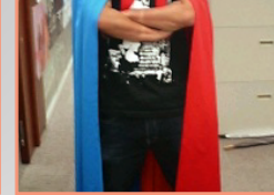
新しい軍団員。リアルエクシード君です。