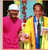
たけし軍団つながり。そのまんま知事です。